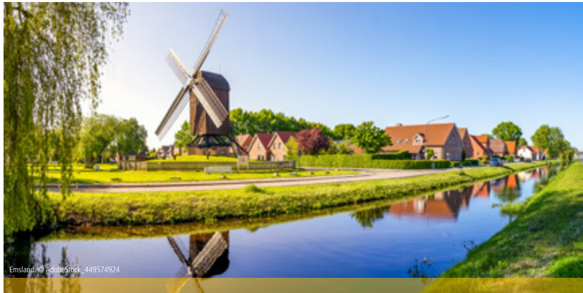
Emsland

Das Radfahrer-Paradies im Nordwesten Deutschland wartet darauf, von Ihnen auf zwei Rädern erkundet zu werden. Das Wegenetz hier ist nicht nur vielfältig, sondern auch bestens ausgebaut. Ihre Radreiseleitung begleitet Sie entlang idyllischer Flussläufe der Ems und durch dichte Wälder sowie geheimnisvolle Jagdreviere. Bei einer Küstenfahrt längs des Wattenmeeres schnuppern Sie Seeluft. Ein besonderer Höhepunkt ist die Besichtigung der Meyer Werft: in dem größten überdachten Trockendock der Welt werden Ozeanriesen gebaut.