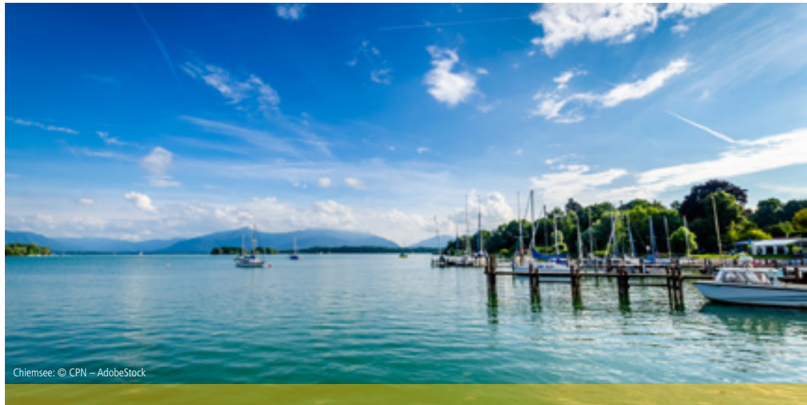
Chiemsee: © CPN – AdobeStock

Auf nach Süddeutschland an den drittgrößten See Deutschlands: den Chiemsee. Das Wasser ist kristallklar, die Luft frisch und das Urlaubsparadies Bayerisches Meer gleicht bisweilen einer Postkartenidylle. Ihr Urlaubsort Prien eignet sich perfekt als Ausgangspunkt für Sternradtouren. Sie können gemütlich auf das tägliche Kofferpacken verzichten und jeder Radkilometer wird zum Genuss. Dazu tragen auch die urigen Gaststätten und herrlichen Biergärten entlang der Strecke bei. Freuen Sie sich auf erlebnisreiche Tage rund um den Chiemsee.